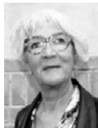
Pia Saaek Lejerforeningen EI/GI