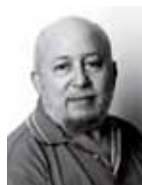
Isak Korn Peder Lykke Centret